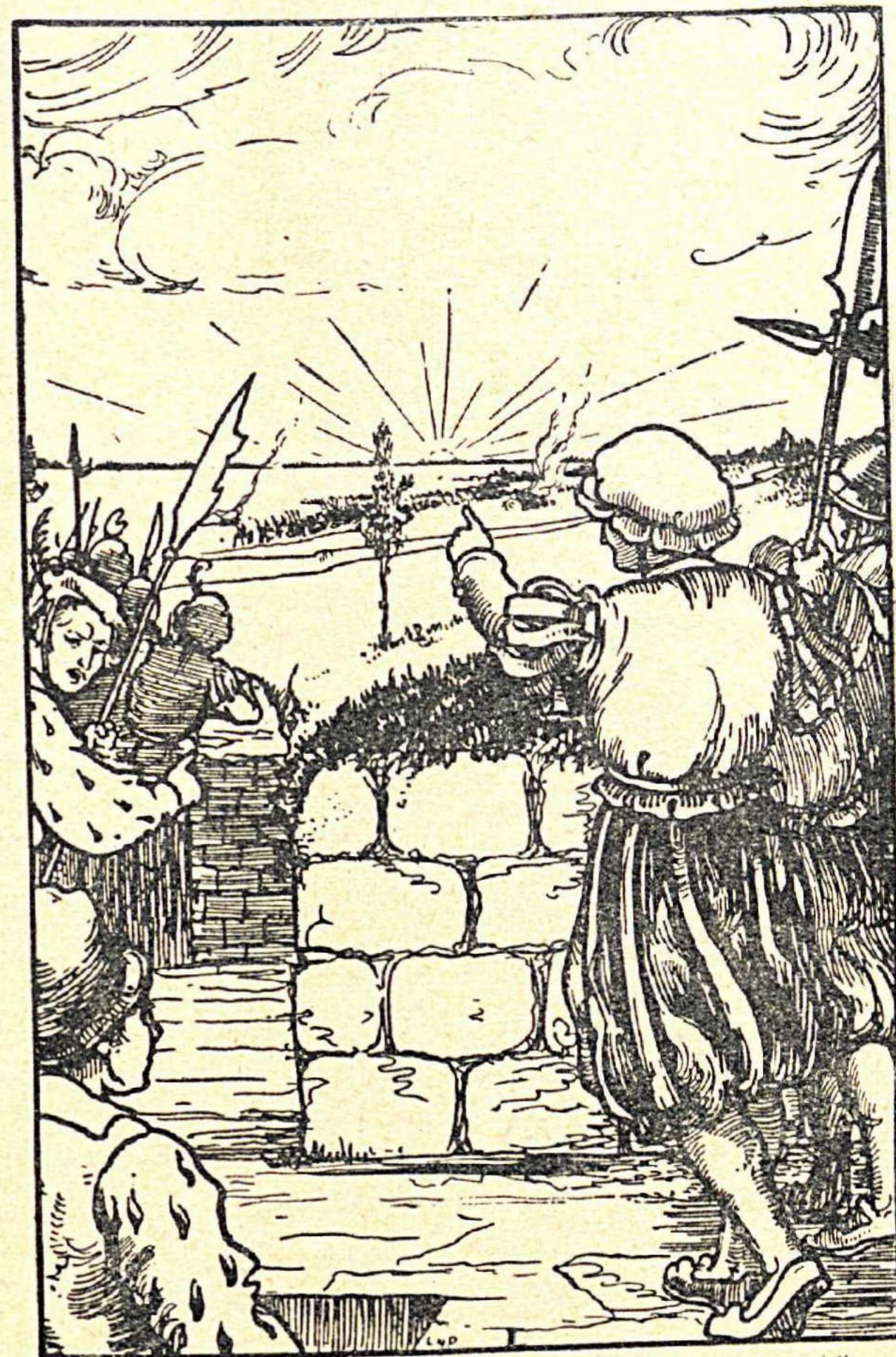
Statig verrees de Julizon aan den Oostertrans. (blz. 14).

— Kunnen wij onze oogen gelooven? zoo vroegen zij elkander af. Geeft de roover het beleg op? Trekt hij weg? En ja 't scheen zoo, want reeds waren de voorposten verdwenen en ginds, langs Berchem, Deurne en Merxem maakte de vijand zich voort.